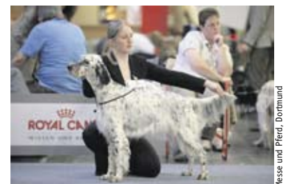
Messe und Pferd, Dortmund

Die Polizei teilte mit, die Hunde hätten vermutlich präparierte Hühnerknochen gefunden. Beobachtungen können bei der Polizei unter Telefon (02222) 919868911 gemeldet werden. (sh)